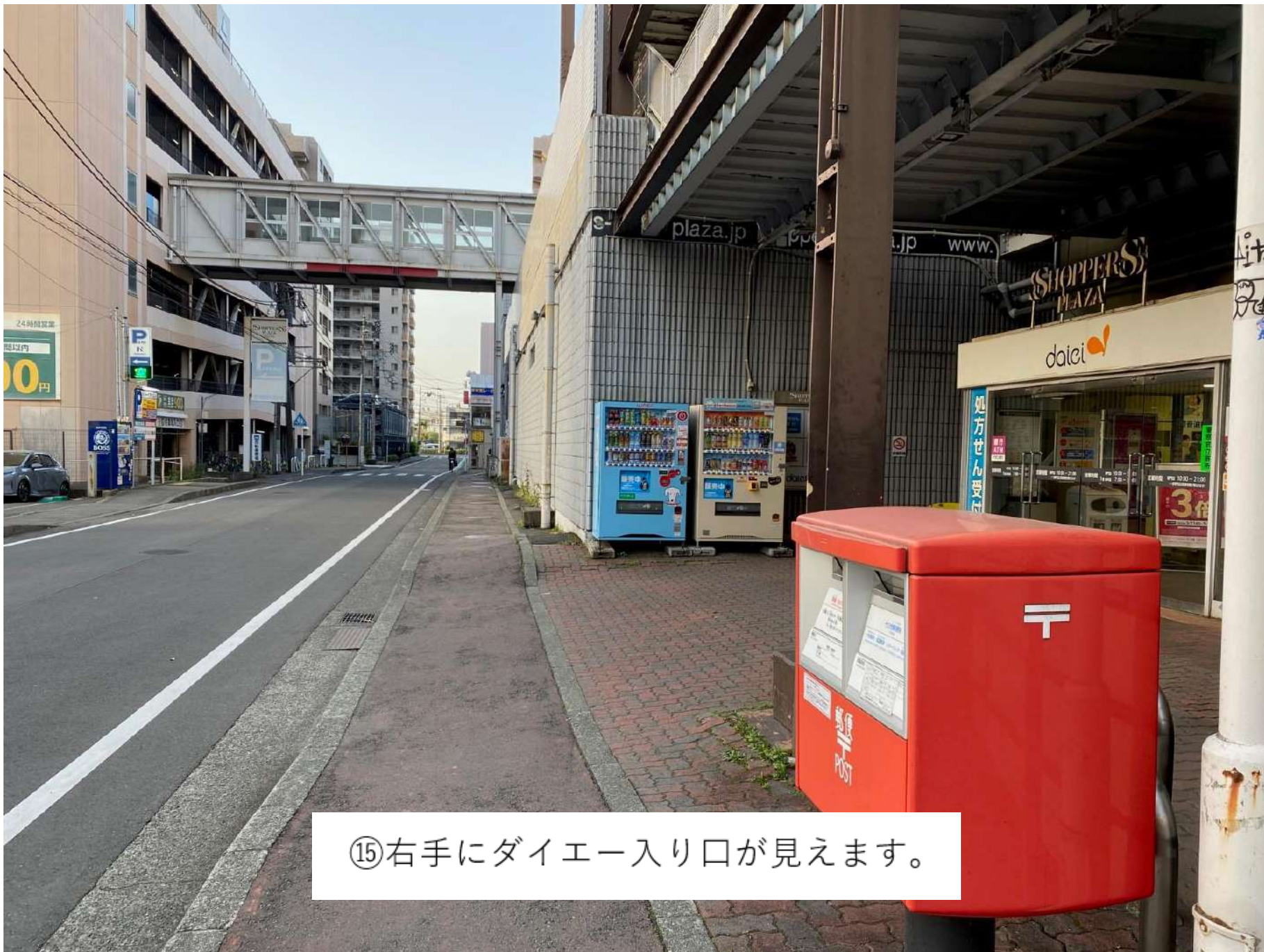
⑮右手にダイエー入り口が見えます。